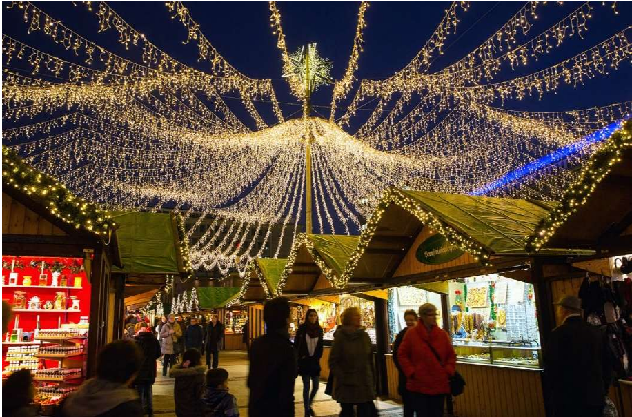
Weihnachtsmarkt Essen Impressionen

Essen macht Weihnachtsträume wahr. Budenzauber, Glühweinduft und Lichterglanz, soweit das Auge reicht. Ein Meer aus zahlreichen Lichtern bildet die einmalige Lichtkrone des internationalen Weihnachtsmarktes. 170 Hütten säumen die großen Straßen und Plätze der Innenstadt. Die kulinarischen Spezialitäten stammen aus 20 Ländern, z. B. peruanische Ofenkartoffeln, französischer Vin Chaud oder mexikanische Churros und zahlreichen Regionen Deutschlands.