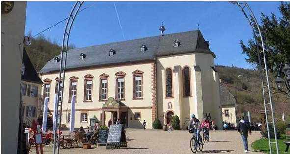
Kloster Machern ( www.ferienhaus-eifel.com )

Umgeben von Weinbergen liegt in idyllischer Lage an der Mosel das Zisterzienserinnenkloster Machern aus dem 12. Jahrhundert. Im Klostergelände kann man viel erleben und bestaunen. Unter Anderem gibt es eine