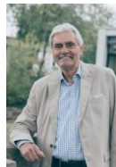
Foto: Heinz Drews jeden letzten Donnerstag im Monat 10.00 – 12.00 Uhr

Heinz Drews steht Ihnen beratend, unterstützend und helfend in allen Fragen Ihres Alltags zur Seite. Auch wenn Sie ein persönliches Gespräch suchen sind Sie herzlich in der Sprechstunde willkommen.