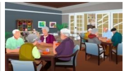
jeden 3. Mittwoch im Monat 15 Uhr

Der Seniorennachmittag ist offen für jede Seniorin und jeden Senior. Gemeinsamer Austausch und ein Thema stehen bei einem guten Kaffee auf dem Programm.