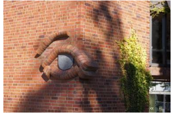
Haus der Evangelischen Gemeinde zu Düren