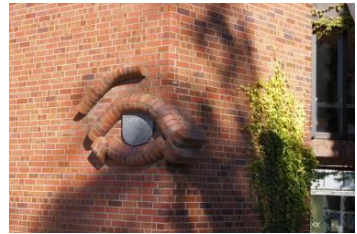
Haus der Evangelischen Gemeinde zu Düren